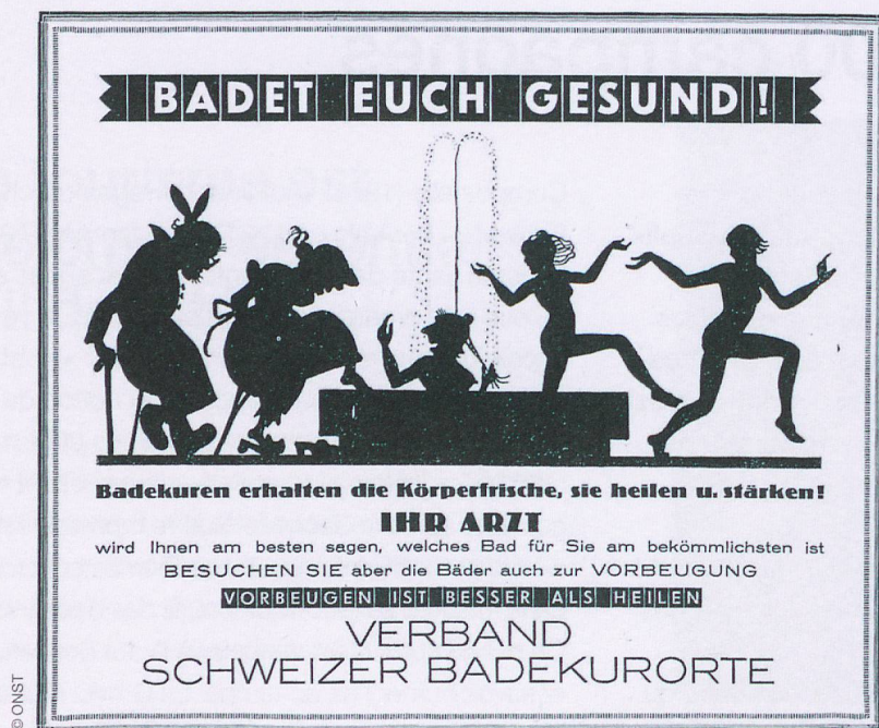
«Sources thermales et baignade en Suisse» (1926), thème de la première grande campagne de l'ONST.