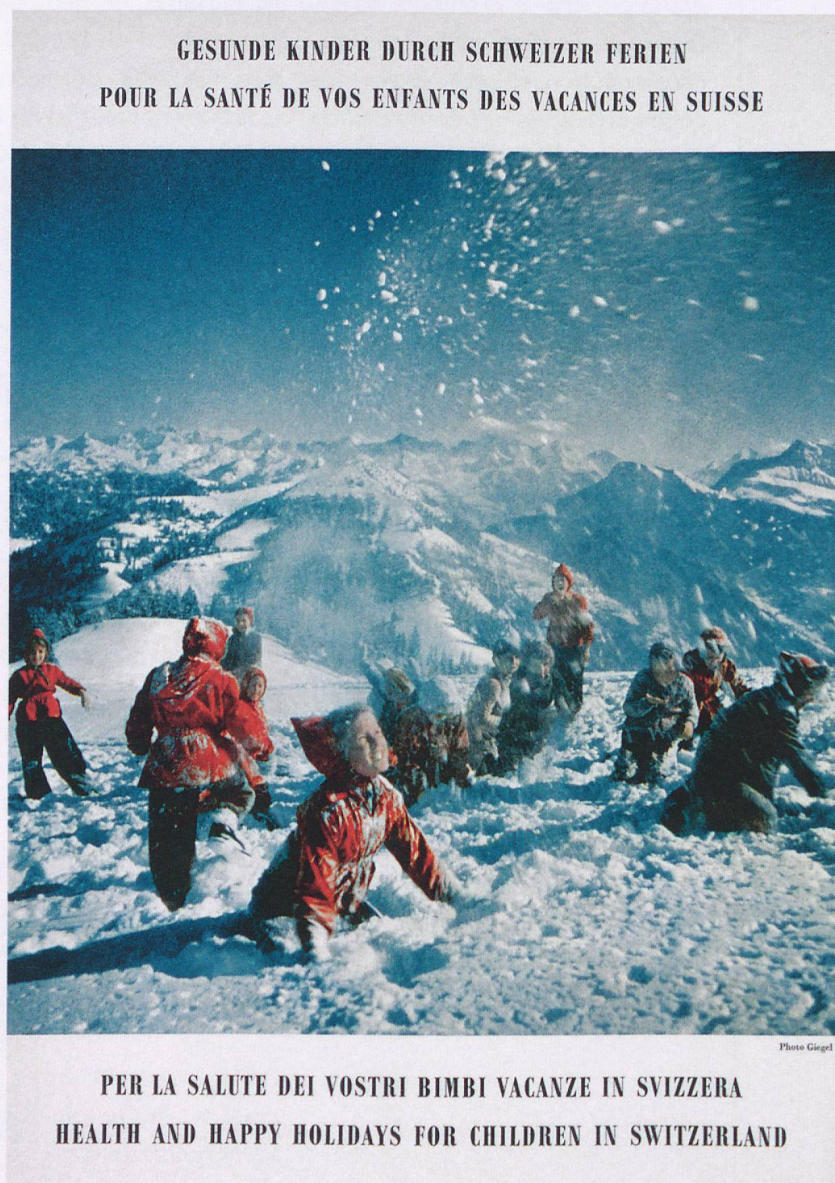
En 1952, le photographe attitré Philipp Giegel met en scène des enfants pour la campagne «Pour la santé de vos enfants, des vacances en Suisse».