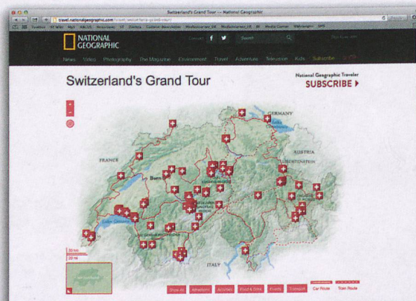
50 sites du Grand Tour de Suisse pour un voyage virtuel sur le site du «National Geographic».