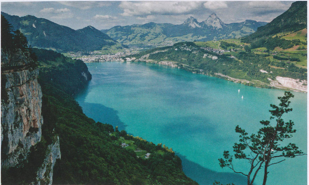
Paysage du Grand Tour de Suisse: vue sur le lac des Quatre-Cantons avec Brunnen et les Mythen en toile de fond.