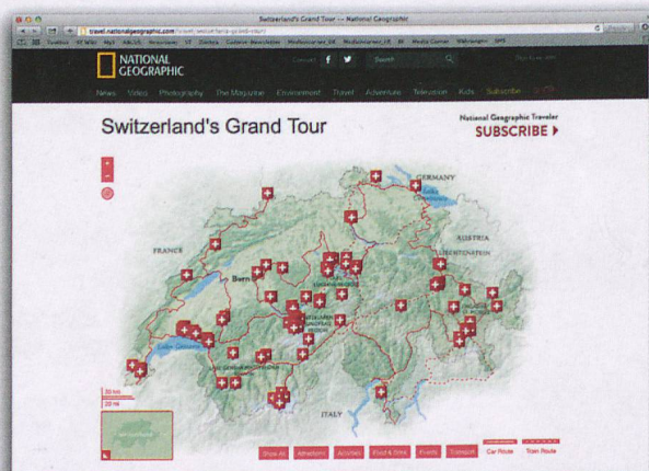
50 sites du Grand Tour de Suisse pour un voyage virtuel sur le site du «National Geographic».