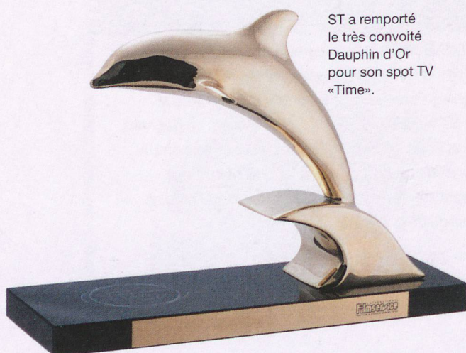
ST a remporté le très convoité Dauphin d'Or pour son spot TV «Time».