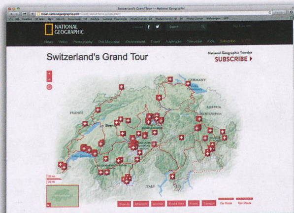
50 sites du Grand Tour de Suisse pour un voyage virtuel sur le site du «National Geographic».