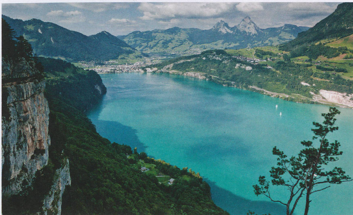
Paysage du Grand Tour de Suisse: vue sur le lac des Quatre-Cantons avec Brunnen et les Mythen en toile de fond.