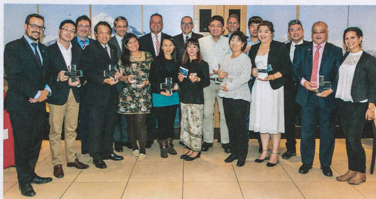
Meilleurs vendeurs de voyages individuels en 2015: les agents les plus performants de 10 pays d'Asie ont été récompensés à Thoun (ici avec des représentants de ST et de la branche).

Cette opération visait à promouvoir les voyages individuels de longue durée parmi les voyageurs venant de marchés lointains. Un programme de promotion et formation a permis de motiver plus de 10 000 agents de voyages, lesquels devaient proposer des voyages alléchants de quatre jours et plus à leurs clients. En plus de ces réservations, les agents étaient motivés par un programme de fidélité spécial de GTA, le principal fournisseur asiatique de voyages individuels. ST a ainsi pu générer au moins 20 000 nuitées supplémentaires.