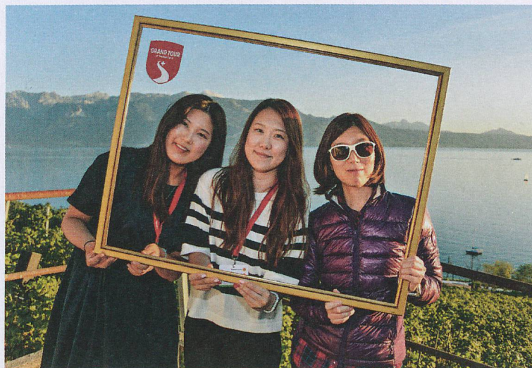
Trois journalistes dans un décor de rêve lors du voyage de presse en Lavaux.

Cette année, le grand voyage de presse de ST a mis le Léman à l'honneur: 139 journalistes spécialisés de 35 pays ont répondu à l'invitation de ST et de l'Office du Tourisme du canton de Vaud et découvert quelques-uns des plus beaux tronçons du Grand Tour. Différents groupes ont ensuite été formés pour découvrir de plus près les autres régions: routes de montagne des Grisons, vallée du Rhône, vie urbaine à Berne, Fribourg et Saint-Gall ou encore châteaux d'Argovie. Les reportages ainsi réalisés devraient représenter l'équivalent d'une campagne d'environ cinq millions de francs.