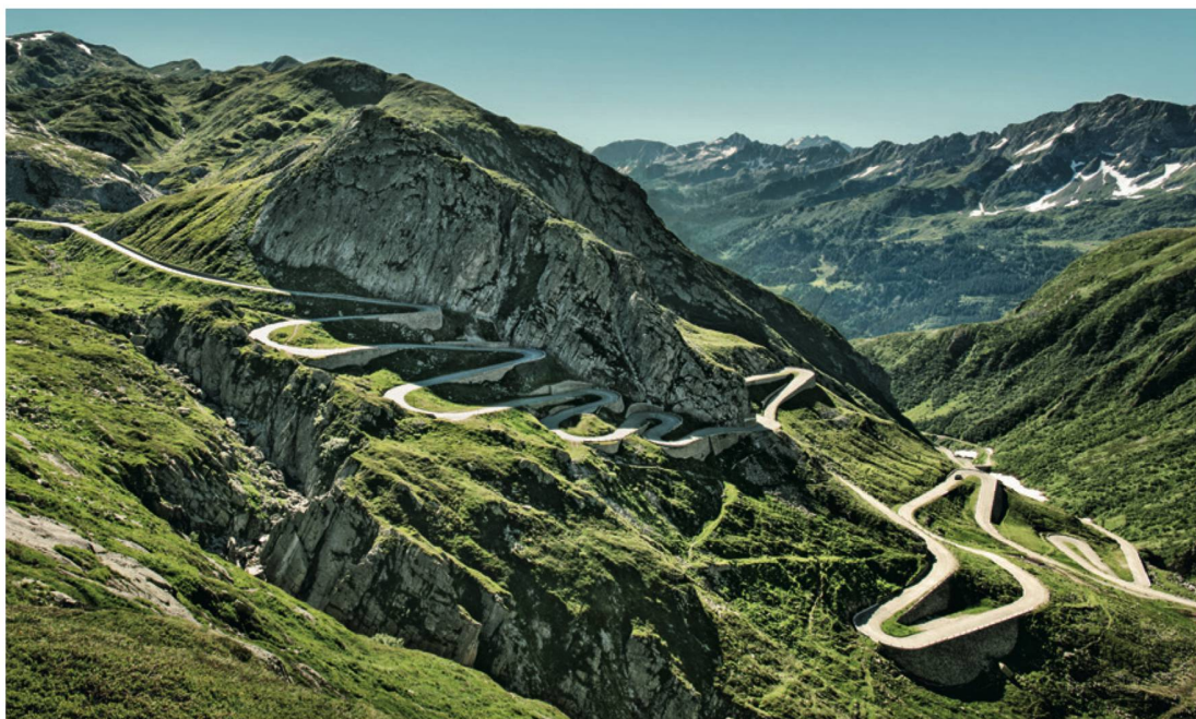
Le «Grand Tour de Suisse» réunit sur plus de 1600 km les hauts lieux touristiques du pays, permettant au visiteur de «réserver» la Suisse avec tous ses contrastes.