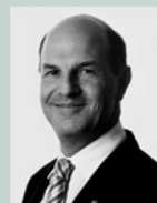
Thomas Winkler Management Portail, e-marketing & informatique