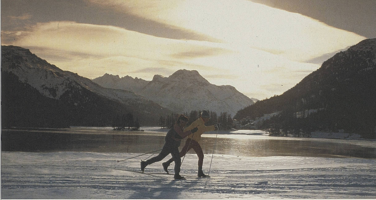
Sur le lac de Champfer en Haute-Engadine, Grisons, les heures s'égrenent paisiblement.