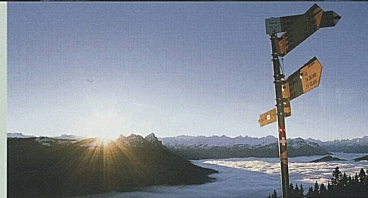
Rigi, Suisse centrale.