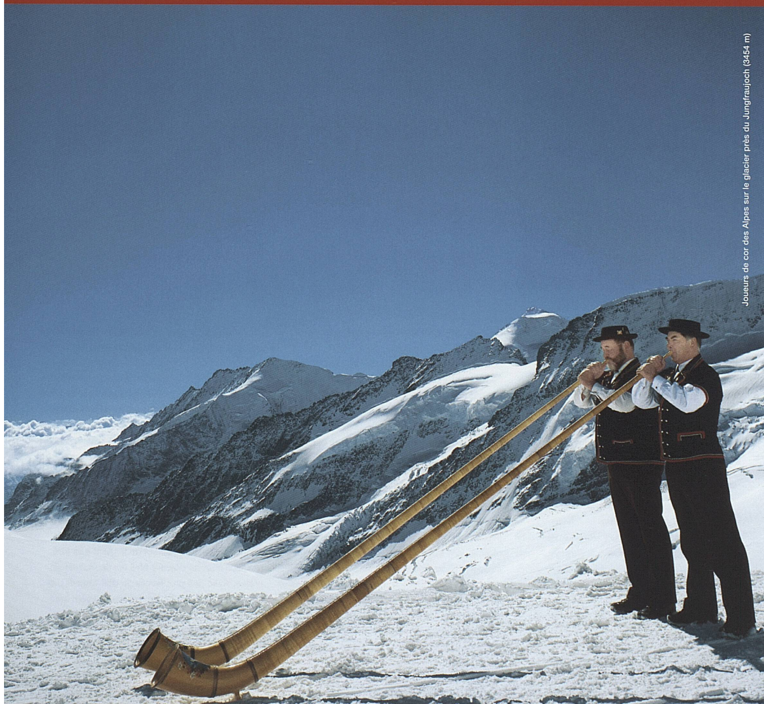
Joueurs de cor des Alpes sur le glacier près du Jungfraujoch (3454 m)

Des activités de marketing efficaces dans un champ de tensions dicté par des conditions-cadres sur lesquelles nous n'avons pas ou peu d'influence étaient demandées. D'importantes augmentations du nombre de touristes en provenance des nouveaux marchés ont influencé positivement le résultat d'ensemble.