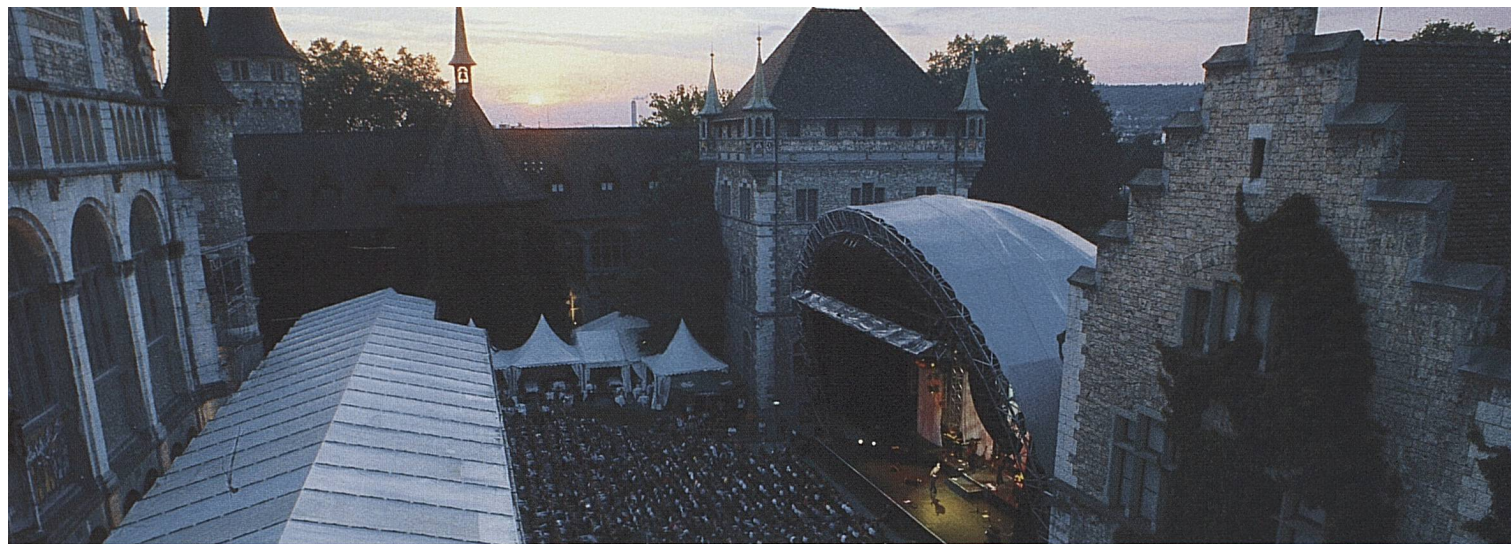
A Zurich, le festival de musique pop «Live at Sunset» a lieu chaque été dans la cour intérieure du Musée national suisse.