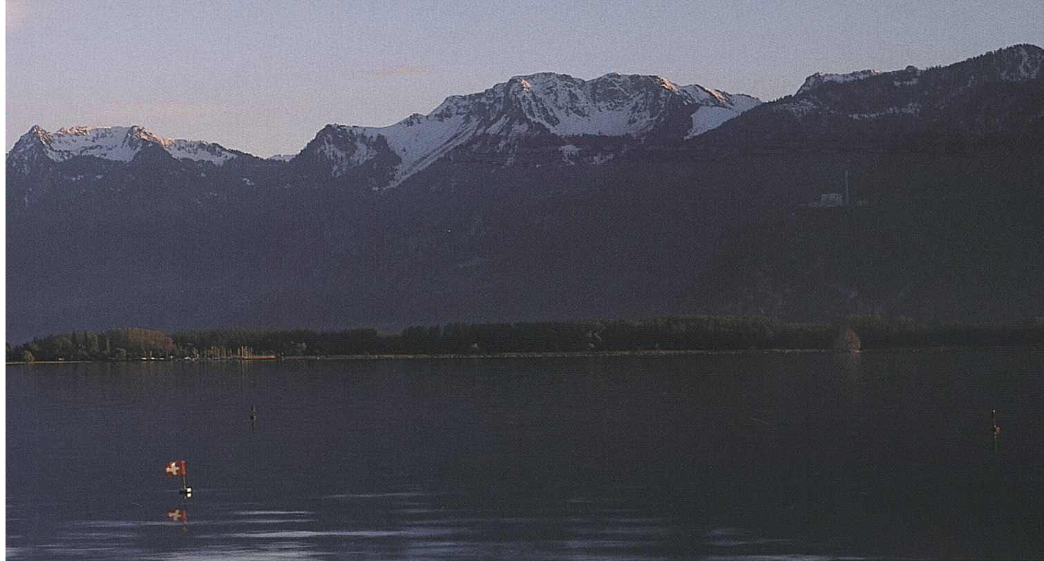
Lac Léman, canton de Vaud. Le château de Chillon avec, à l'arrière-plan, les Dents du Midi (3257 m).