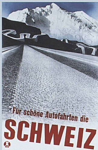
Herbert Matter, En route pour la Suisse, 1935

Un retour en arrière sur presque 85 ans de promotion du tourisme suisse nous montre bien son évolution et sa constance. Au début, ce sont les montagnes légendaires, comme dans l'affiche de l'artiste Emile Cardinaux de 1921: «L'été en Suisse». Jusqu'à ce jour,