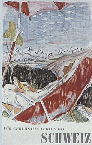
Alois Carigiet, Vacances de repos en Suisse, 1953