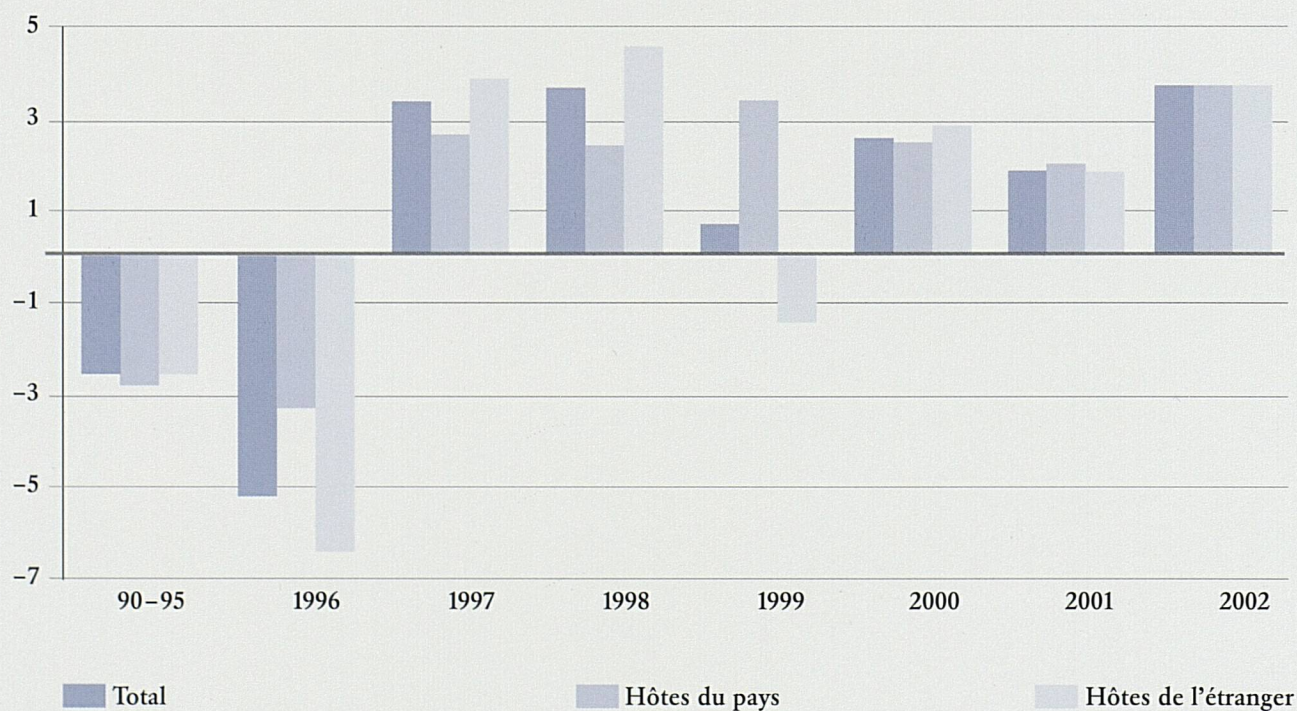
Evolution des nuitées dans l'hôtellerie suisse.