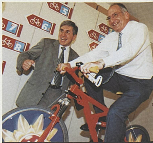
14 mai. Conseiller fédéral P. Couchepin à vélo!

Le 14 mai 1998 ont eu lieu à Zurich trois importantes manifestations de Suisse Tourisme: la 58e assemblée générale des membres de Suisse Tourisme, à laquelle était rattachée la première remise du label de qualité à 32 entreprises touristiques et, l'après-midi, en présence du conseiller fédéral Pascal Couchepin et de nombreux représentants de la politique et de l'économie, l'inauguration de la nouvelle adresse de