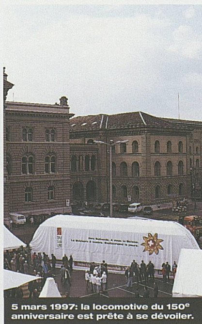
5 mars 1997: la locomotive du 150 e anniversaire est prête à se dévoiler.

La cérémonie officielle d'ouverture du jubilé «150 ans des chemins de fer suisses» a eu lieu le 5 mars 1997 à Berne. Suisse Tourisme a soutenu durant toute l'année les nombreuses activités marquant cet anniversaire. Des programmes spéciaux ont été élaborés sur les marchés les plus importants en collaboration avec les Chemins de fers fédéraux et d'importants voyageurs ferroviaires. Des voyages d'études pour les professionnels du voyage et des contributions dans les médias ont contribué à positionner la Suisse comme pays de voyages en chemin de fer par excellence.