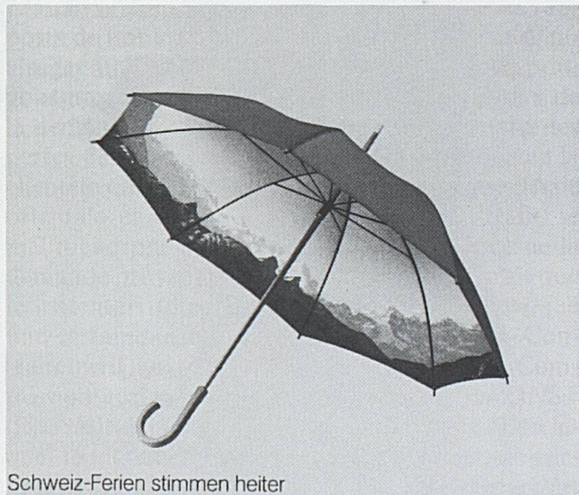
Schweiz-Ferien stimmen heiter

Nos brochures d'agence, ainsi que la carte ferroviaire et routière contenaient des annonces pour la Carte suisse de vacances, des annonces des représentations de Swissair, du Centre du Swiss Bankers Travellers Cheque et des assurances Winterthur.