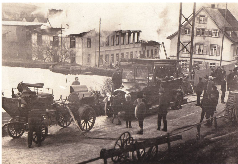
1926 fiel die Mühlebaufabrik Glarner einem Grossbrand zum Opfer. Ansicht des Brandplatzes, vorne unterer Fabrikweiher.

Das Heim bot Platz für 18 bis 20 Kinder, «aber selbst unter Zuzug von auswärts, insbesondere vom städtischen Fürsorgeamt St.Gallen, gelang es nicht, mehr als 14 bis 15 Kinder zu bekommen». 19 Für die Renovation und den Umbau des Hauses sowie für diverse Anschaffungen für das Heim waren Fr.31 100 aufgewendet worden. Der Betrieb verbrauchte langsam das verbleibende Ka-