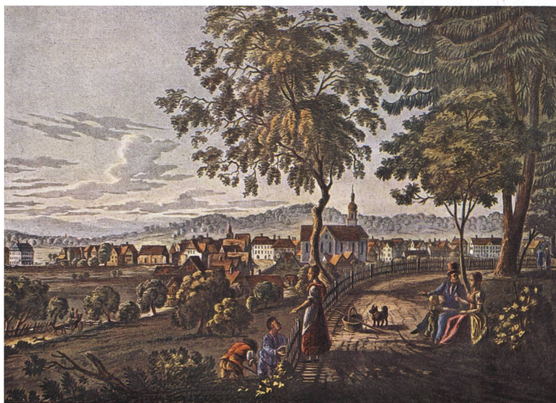
Stadtbühlark um 1830 – Nach einem Stich von Johann Baptist Isenring.

Ein ganz kleines Pärkli blieb nach dem Abbruch eines Hauses noch bestehen, das wegen seiner wenig attraktiven Lage an der vielbefahrenen Herisauerstrasse kaum benützt wird. Die kleine, noch heute sichtbare Erhebung im hinteren Teil der Parzelle, der sogenannte Sandhügel, muss einmal ein Brutplatz für Sandschwalben gewesen sein. Der Hügel stand deshalb unter Naturschutz. Wahrscheinlich wurde die Schutzzone aber zu spät errichtet, die Vögel blieben aus. Ich bin an der Bot-Künzle-Strasse