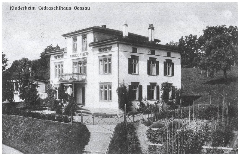
Das Gebäude, Andwilerstrasse 27, wurde in den Dreissigerjahren als Kinderheim genutzt.