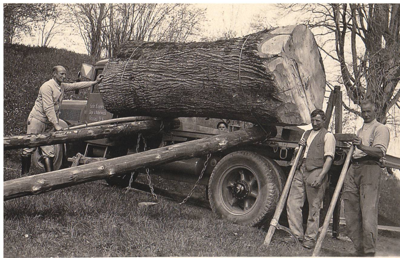
Abtransport einer gefällten Linde durch Firma Gebr. Eisenring, Säge- und Hobelwerk.

Der Baumbestand wurde von den Bewohnern immer wieder Baum um Baum auf Karten aufgezeichnet. Nachpflanzungen erfolgen heute bewusst mit einheimischen Bäumen. Mittlerweile ist kaum noch ein Baum übrig von der originalen Parkbepflanzung, die doch einige «Exoten» enthielt, wie es sich für einen Park im vorletzten Jahrhundert gehörte. Ausnahmen sind stattliche Buchsbüsche und eine grosse Eibe beim Cedraschi-Haus.