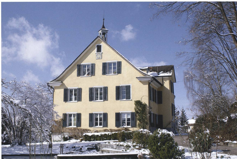
Haus im Park, Ansicht von Osten.