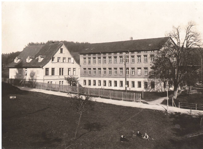
Mühlebaufirma Glarner + Co. AG, ca. 1910.