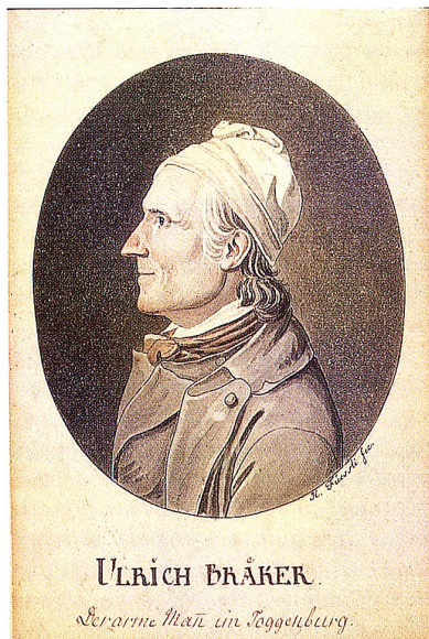
Ulrich Bräker, der Arme Mann im Toggenburg.

Auch Bräker, der als Weber und Fergger sein Geld verdiente, geriet durch die Wirtschaftskrise 1795 in schwerste Armut, von der ihn nur noch 1798 der Tod erlöste. Der aufgeklärte Toggenbur- ger war jedoch kein Freund der Revo- lution, sondern ein Liebhaber echter Bil- dung und einer friedlichen Zusammen- arbeit zwischen Volk und Landesherrn. Kolorierter Umrisstich von H. Füssli, 1797. Kantonsbibliothek (Vadiana) St.Gallen.