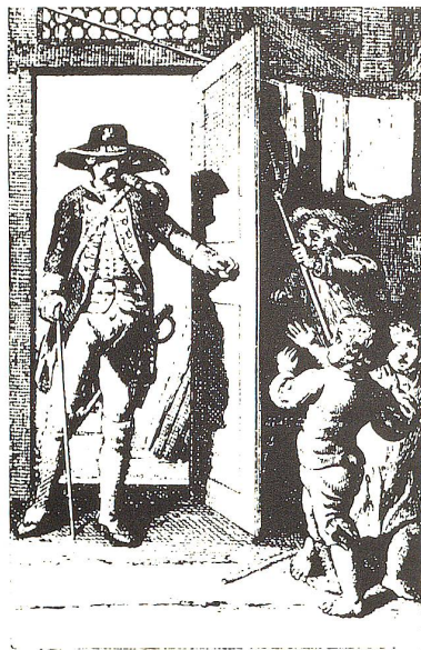
Ulrich Bräker in preussischer Uniform: Bei der Heimkehr aus dem Söldnerdienst (1756) wird er von seiner Familie im ersten Moment nicht erkannt.

Joel: He, da kommt ein alter Preusse, he, was gibts Neues im Toggenburg? Wollt ihr mit den Gossauern nicht