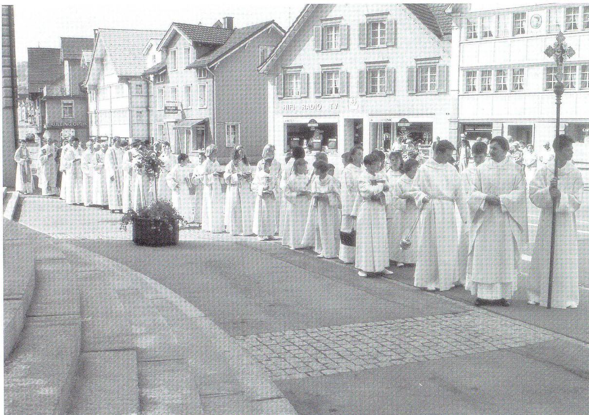
Feierlicher Einzug in die restaurierte Kirche

fügen, den der Geist Gottes baut» (1 Petr. 2.5), denn «ihr seid das erwählte Volk von Königen, die Gott als Priester dienen, ein heiliges Volk, das Gott selbst gehört» (1 Petr. 2.9).