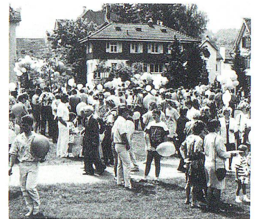
Nach dem Festgottesdienst Apéro mit Spiel und Plausch

Seit Ezechiels Traum sind viele neue Tempel gebaut und geweiht worden. Ihr Zweck bleibt bis heute der gleiche: dass aus ihnen Wasser fliesse, das überall Leben entstehen lässt. Wir brauchen einen Tempel, von dem lebendiges Wasser kommt, und wir brauchen jenes Wasser, das nicht aus einem toten Tempel aus Stein entspringen kann. Wenn auch erst am Ende der Zeiten vollendet, ist der erträumte Tempel wenigstens umrisshaft in der Andreas-Kirche schon jetzt sichtbar. Möge er auch jetzt schon wirksam sein, Leben ermöglichen, dem Leben dienen, Gott erfahren lassen als den «Liebhaber des Lebens» (Weish. 11,26).