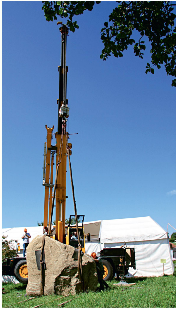
Abb. 2: Der Deckstein wurde mit dem Kran abgehoben. Hier ist die trapezförmige Bearbeitung der Platte zu erkennen.

Funde aus diesen direkt an die Steinkonstruktion anstossenden Schichten belegen, dass der rund 2,5 \times 4,5 m grosse und ursprünglich wohl über 1,5 m hohe Dolmen mindestens bis ins 13. Jahrhundert zum grössten Teil überirdisch sichtbar war. Vermutlich lagerte sich das Sediment in seiner Umgebung bei verschiedenen Hochwasserereignissen im Lauf der Zeit ab. Ein besonders heftiges Hochwasser dürfte auch der Grund sein, dass die Anlage seitlich verschoben und etwas nach Südwesten abgekippt war. In der Umgebung des Dolmens belegen Gruben mit bronzezeitlicher Keramik eine Nutzung des Areals in einer Zeit, als die Grabstätte wohl nicht mehr benutzt wurde. Unter den zum Dolmen gehörenden Niveaus konnte ausserdem eine Schicht beobachtet werden, die neben zahlreichen Silexabschlägen auch eine mesolithische Silexspitze enthielt und vielleicht anzeigt, dass hier bereits lange vor dem Bau des Dolmens menschliche Aktivitäten stattfanden. Die C_{14} -Datierung eines Holzkohlesplitters in den Zeitraum um 9000 v. Chr. bestätigt diese Annahme.