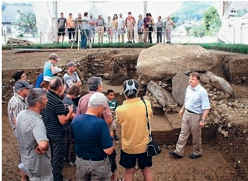
Abb. 1: Beim Freilegen des Dolmens zeigte sich, dass er geschützt vom Geschiebe des Mühlebachs die Jahrtausende überdauerte. Blick nach Norden

Die Führung des Archäologischen Dienstes auf der Grabung des Dolmen stiess auf grosses Interesse