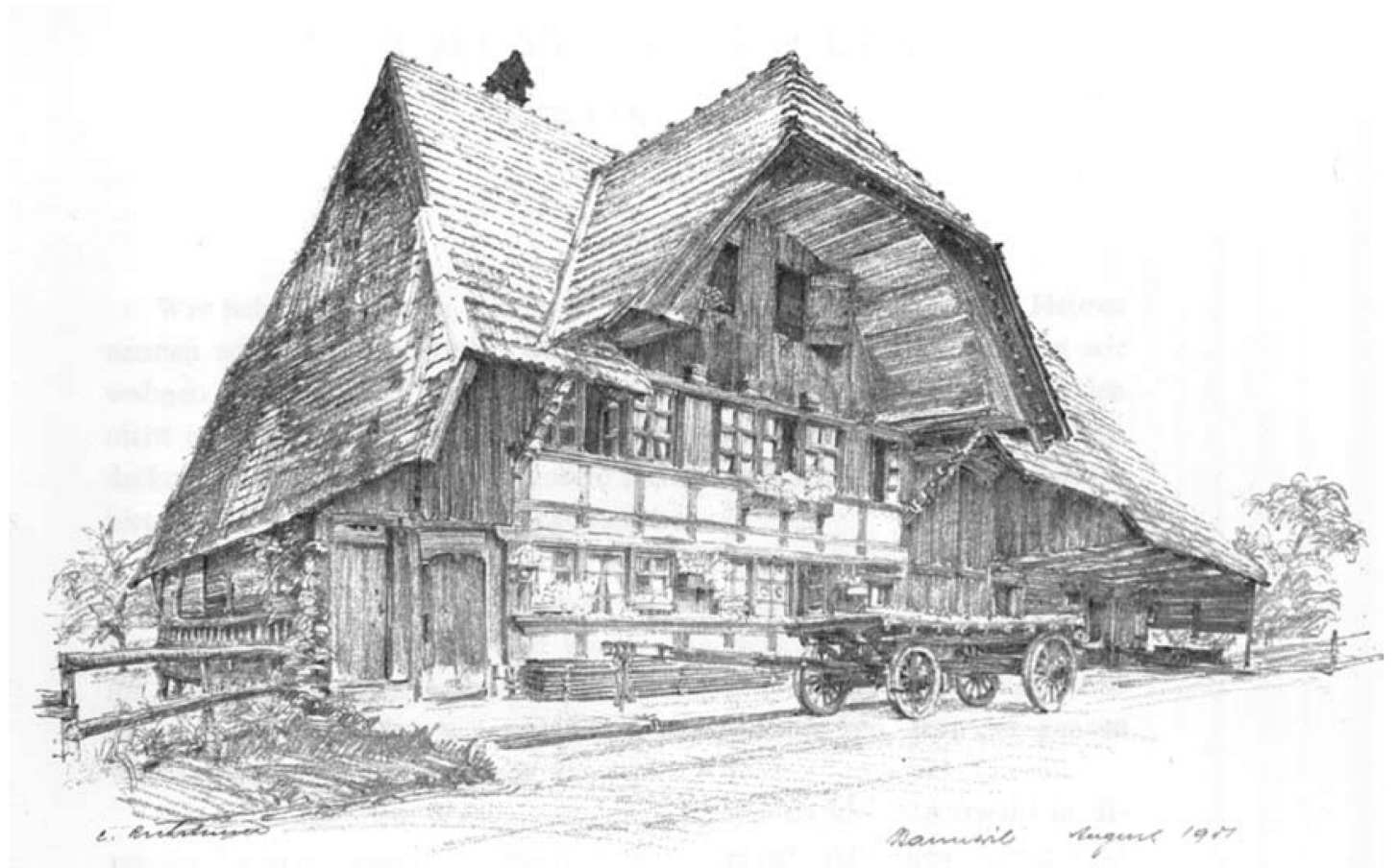
Zeichnung Carl Rechsteiner