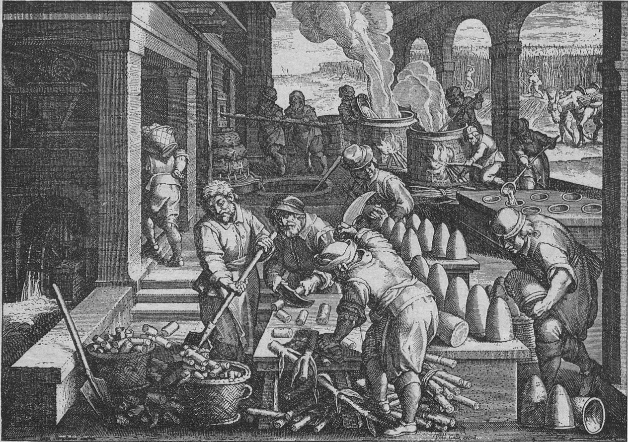
Zuckersiederei nach einem Kupferstiche aus dem Jahre 1570.

„Der genügend geläuterte Saft wurde alsdann bei gelinderem Sieden, welches man später durch etwas hineingeworfene Butter zu mässigen pflegte, abgedampft. Der gare Sud wurde endlich in die kegelförmigen, aus Thon gefertigten Zuckerformen gebracht, darin etliche Male herumgerührt und nachher zum Ablassen des Syrups an den Spitzen geöffnet. Ob schon das