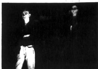
CAT RAPES DOG mit zwei brandneuen Tracks auf der nächsten NL-Single in N.47