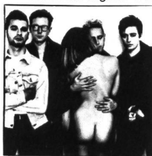
Depeche Mode's Skandalchen

tun dies, clever, mittels eines ach so skandalösen, neuen Pressefotos. Clou des Bildes: Martin L. Gore wird von einer nackten Schönen vor den Augen seiner zerknirschten Bandkollegen umgarnt. Ob das den Gerüchten abhelfen wird, die da besagen, Martin sei bi-sexuell...?