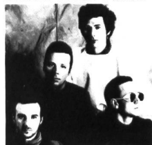
Ultravox versuchsweise wieder