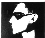
Richard 23 im Aufwind...