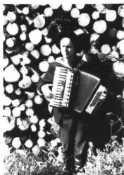
Mart auf Solopfad

Noch mehr hätte nun wirklich nicht mehr schief gehen können: Morgens um acht wurde als erstes ihr Tourmanager von der Zürcher Polizei im Hotel verhaftet (wegen einer läppischen, unbezahlten Rechnung aus der 87er Erasure-Tour von SFR. 185.--), danach verzögerte sich der Soundcheck aus technischen Gründen um Stunden, dazu machte noch die Freundin telephonisch Schluss mit dem Sänger und als Abschluss musste ihr Konzert nach etwa 30 Minuten abgebrochen werden. Die Rede ist von Nitzer Ebb und ihrem ersten Gastspiel in Zürich. Nitzer bewiesen trotz allem Grossmut: Sie verzichteten auf ihren freien Tag und kehrten nochmals nach Zürich zurück: Zu einem Gratis-Konzert. Ein feiner Zug!