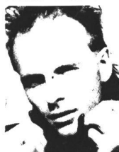
Mr. Uno's 2. Streich