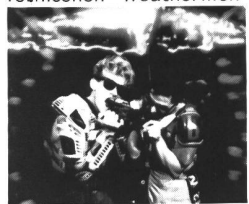
Kill the weathermen!

Bös daneben gegriffen haben die kalifornischen "Weathermen" mit ihrer neuen Maxi "Bang": So eine geballte Ladung Scheisse ist schon lange nicht mehr veröffentlicht worden! Hätte einer erfahrenen Gruppe eigent