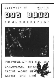
12/87 - Cactus World News, Peter Gabriel, Nico, M/A/R/R/S. Interviews: Der Plan, Cetu Javu, Camouflage