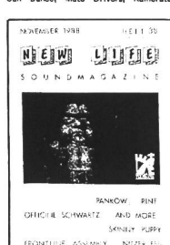
11/88 - Pankow, Coll. Interviews: Skinnz, Puddy, Nitzer Ebb, Frontline Assembly, Officiele Schwartz