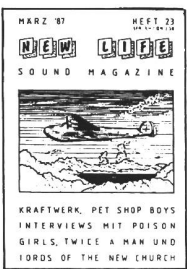
3/87 - The Cure (III), Pat Shop Boys, Commodores, The Mission, Lords of the New Church. Interviews: Twice a Man, Poison Girls, Killing Joke