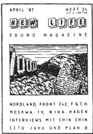
4/87 - The Cure (IV), FGT4, New Scientists, Cetu Javu, Obscure, F242, Diamanda Galas, Die Ärzte, Nina Hagen. Interviews: Chin Chin, Plan B, Cetu Javu