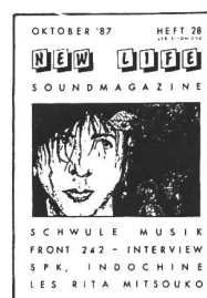
10/87 - Schwiss Musik, Les Rita Mitsouko, SPK, Depeche Mode, Indochine. Interviews: Die Gants, Front 242, J.D. Fanger (DM-Tourmanager)