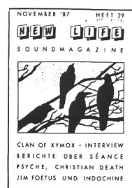
11/87 - Indochine (II), Foetus, Psyche, Christian Death, Curiosity Killed the Cat. Interviews: Seance, Clan of Xymox