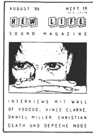
8/86 - Marc Almond (Part II), Mute-Story (Part III), Clan of Noise. Interviews: Daniel Miller, Depeche Mode, Wall of Voodoo, Erasure, Christian Death und Depeche Mode