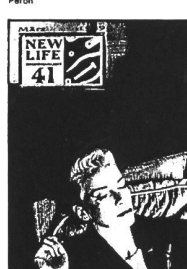
3/89 - Die Form, Swamp Terrorists, Johnny Thunders, Eurythmics. Interviews: Die Goldenen Zitronen, Pink Turns Blue, Invincible Spirit, Inv.Limits

Nur die oben aufgeführten Titel sind noch erhältlich. NEW LIFE No.11, 27 und 40 sind nur noch in Antiquariaten und in Altpapiersammlungen erhältlich, leider aber nicht mehr bei uns! Sorry, aber Nachdruck unmöglich!