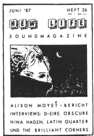
6/87 - Alison Moyet, Siouxsie & the Banshees (II). Interviews: Brilliant Corners, Nina Hagen, Obscure, D-Sire, Latin Quarter