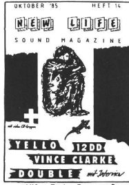
10/85 - Twelve Drummers Drumming, Yello, Vince Clarke, Double. Interview: K. Maloo (Ping Pong, Double)