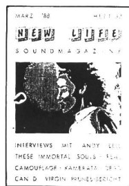
3/88 - The Virgin Prunes, Propaganda. Interviews: Andy Bell, These Immortal Souls, Real Camouflage, Dead Can Dance, Mute Drivers, Kamelaria