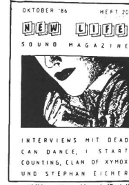
10/86 - Marc Almond (Part III), Mute-Story (Part III), Clan of Noise. Interviews: Dead Can Dance, Start Counting, Stephan Eicher, Vince Clarke und Stephan Eicher