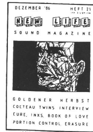
12/86 - The Cure (I), Erasure, Annabel Lamb, Insa, 3 Mustaphas 3, Allen Saxe, Franks, Book of Love, P. Control. Interview: Cocteau Twins