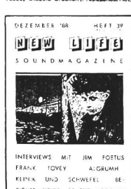
12/88 - The Fields of the Nephilim, Die Gants, 150 BPM. Interviews: Frank Tovey, Jim Fortus, 4Grum..., The Klinik, Schwafel, Sonic System