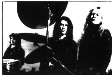
New Model Army im Interview

In dieser Ausgabe findet Ihr Berichte über die SIMPLE MINDS, Martin Eicher, The Silencers sowie Interviews mit FRONT 242, Nitzer Ebb, New Model Army, Cassandra Complex, The Fixx und Phillip Boa. Was wollt Ihr noch mehr? Was? Eine Gratis-Single wird gewünscht? No problem! Carlos Perón's tiefgründig ironische Persiflage auf das Musicbusiness, die Single "A Hit Song" liegt bei.