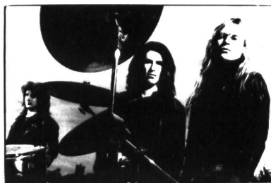
New Model Army im Interview