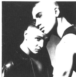
nitzer ebb: hearts & minds