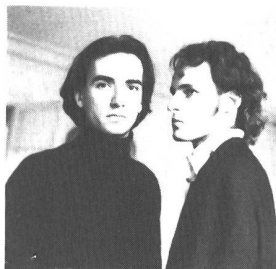
touch el arab: zum Duo geschrumpft

Zuerst war immer nur die Rede von einer bevorstehenden Operation, doch nun wurde es offiziell bestätigt: Cevin Key, Kopf & Motor von Skinny Puppy hat die Band endgültig verlassen - die gesamte Europa-Tour musste so wieder abgesagt werden. Schade!