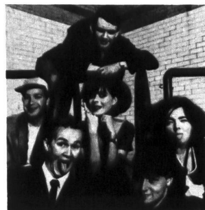
Der Mega-Hype aus Island on Tour (Seite 39)

Hier sind wir also wieder zurück - zu- rück mit einer vollständig umgestalteten, schöneren, dickeren und umfassenderen NEW LIFE als je zuvor. Dass diese Ausgabe nicht der Weisheit letzter Schluss sein wird, werdet Ihr im Verlaufe der nächsten Ausgaben feststellen können: NEW LIFE wird sich weiter, hoffentlich zum besseren, verändern. Doch die "Radical Revolution", die sich mit No. 40 vollzog, beinhaltet weit mehr als nur ein neues Outfit und neue Rubriken für das Magazin. Gleich- zeitig mit No. 40 haben wir uns und Euch auch einen lange gehegten Wunsch erfüllt: ART SOUND - die New Life eigene Konzertagentur! Schwerpunkt in unserem hoffentlich grossen Konzertangebot wird Techno sein. Blättert auf Seite 34, und Ihr lest, wer den Anfang in unserer Con- cert Agency macht. Bestätigt sind be- reits Gigs mit PANKOW und SEANCE mit denen wir eine ganze Tour quer durch Europa starten werden, ausserdem werden wir in den nächsten Monaten folgende Bands in die Schweiz bringen: KLINIK, VOMITO NEGRO, FRONTLINE ASSEMBLY, BORGHESIA und andere. Mehr Details zu diesen aussergewöhn- lichen Bands, folgen regelmässig in New Life (wo denn sonst?).