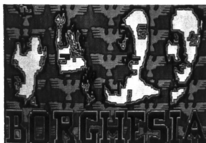
Borghesia aus Jugoslawien im Interview (Seiten 19-21)