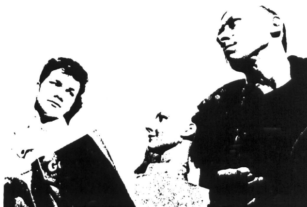
In eigener Sache: SKANDAL BEI NEW LIFE!?!

Von der LP "My Translucent Hands" erschien eine limitierte Auflage in durchsichtigem Vinyl (in England!). Ausserdem sind sämtliche Singles und die Mini-LP in Deutschland auch in farbigem Vinyl erschienen.