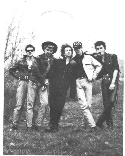
A-DEPECHE habens echt geschafft, Werbung zu machen auf'm kleinen Label!

J-Ja, aber das liegt daran, weil da Leute sitzen, die arbeiten. Bei den meisten Vertrieben hier in Deutschland ist es wirklich grausam, weil die einfach das als Job oder Hobby ansehen! Die checken nicht, dass da mehr dahintersteckt. Da muss rangeklotzt werden. Unsere Platten sind immernoch nicht richtig erhältlich, in West-Deutschland. Die kriegste zwar in Hamburg oder Hannover aber ich krieg immer wieder Anfragen, so aus Frankfurt oder aus der Schweiz; da gibt's die Platten nicht. Dann frag ich im Vertrieb nach und die sagen: "Ja, die müsste's eigentlich geben, muss ich mal anrufen!" Dann kann man nicht bekannt werden, dann kann man nicht Platten verkaufen, wenn sie nicht in den Läden stehen. Es ist schwierig!