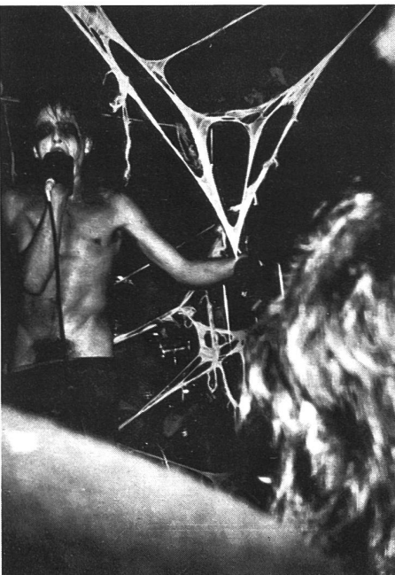
Aufnahme von einem '85er Gig in Nik Fiend

Im Frühjahr zieht die Band durch ganz Europa, wo sie wohl ihre beste Tournee bestritten. Sehr ungewöhnlich erschienen vielen Fans, die im August erscheinenden Werke "I'm doing time in a maximum security twilight home" (12") und "Maximum Security" (LP). Genial, sagen die einen, zu soft, sagen die anderen. Sicher ist, dass dies die kommerziellsten Werke ALIEN SEX FIENDS waren.