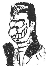
Dave Gahan