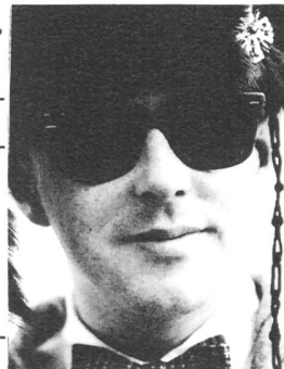
HOLLY JOHNSON - süß?

F.G.T.H. ist somit in der Lage, auch ihre schlechten (und es sind nicht wenige) Songs an den Mann zu bringen. Live gelingt ihnen das vorallem unter Mithilfe von Knall- und Lichtstarken Feuerwerkskörpern, die sie immer in den richtigen Momenten detonieren liessen.