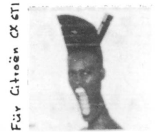
Für Gioen CX GTI