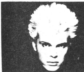
Billy Idols Einfallosig- keit ist echt ätzend... Trotzdem: WHY CLASH SMILE ist die neue LP und kommt im November