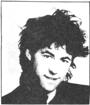
Als Dr.Dr.Prof.iur.etc. hätte es Bob Geldof wahrscheinlich geschafft