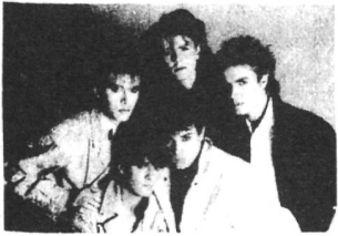
DURAN DURAN = POWER STATION = ARCADIA