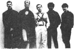
FRANKIE GOES TO HOLLYWOOD FRANKIE GOES TO IRELAND WELCOME TO THE NEW LP !

Fränki gous tu holiwud für's Kinder- zimmer: Das grosse Geld- verdienen mit COMPUTER - SPIELEN