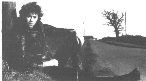
BOB GELDOLF - Probleme mit der äthiopischen Regierung