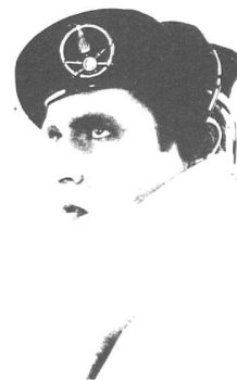
SIMON DE NOTRE DAME

die verblüffende Lösung: Man rafft alle verbliebenen Singles zusammen, tut das ganze in eine lustige Schachtel, schreibt irgendwas von Singlecollection und limitierter Auflage drauf, und schon reissen sich die gleichen Fans um die alten Scheiben, die vorher nie mehr eine FLOCK OF SEAGULLS-Single angerührt hätten. Clever, hä! Ganz so neu ist die Idee allerdings auch wieder nich. U2 haben das ganze schon vor 2 Jahren durchgegeben, mit ebensogrossem Erfolg.