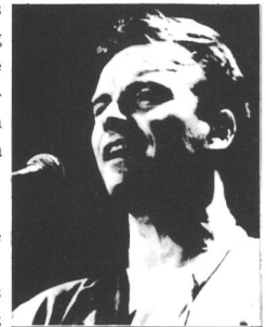
STING - Pionier im Filmbusiness