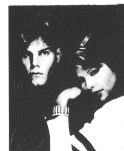
PIA ZADORA versucht jetzt als Filmstar