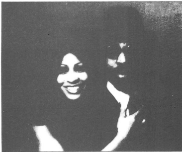
Ein Bild aus glücklichen Ike & Tina Turner - Tagen.

Ueberhaupt gilt der Trick, in jedem schlaffen Schweißfilm ein Showbizstar einzubauen in Hollywood derzeit als todschick. STING, BOWIE und CHER vollbrachten da wahre Pionierarbeit. Eine neue Welle mit MADONNA (die unvermeidliche), VANITY (Six), GRACE JONES (007), TINA TURNER (so tief ist sie gesunken), BARRY MANILOW (Kommentar überflüssig) und RICK SPRINGFIELD (Der wohl nie mehr erwachsen wird) ist längst am anrollen. Hot Gossips rät: Ueberrollen lassen, lohnt sich nicht! Fast niedlich dagegen mutet der deutsche Versuch an, das amerikanische Vorbild zu kopieren. Die deutsche Antwort auf Madonna und Vanity 6 nennt sich (hohoho): TRIO - peiinnlich! Gut ist auch jener: Abgeschlafener Disco-Altstar DIANA ROSS (Upside Down), seit Jahren erfolglos darum bemüht, ihr Comeback zu starten, unternimmt