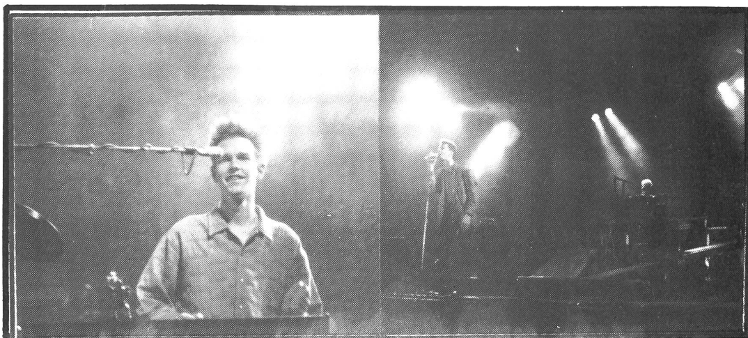
FLETCH scheint zufrieden zu sein

Nur ja, wenn wir sie dann alle Jahre in Montreux hätten, wäre doch toll, nicht?