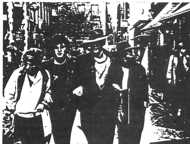
FAN-CLUB IN CARMARKY-STREET