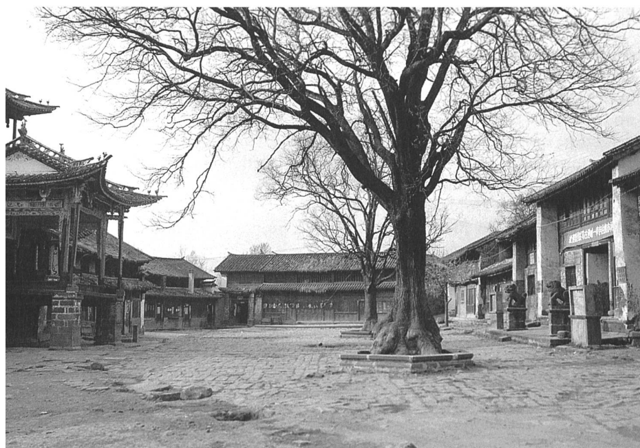
Marktplatz von Shaxi in Südwestchina mit dem Tempeltheater (oben).