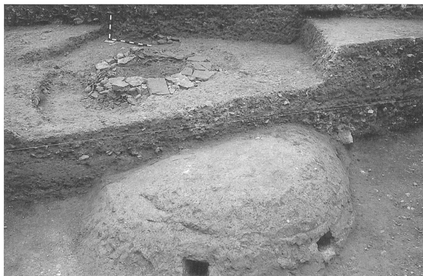
Das neu entdeckte Römergewölbe von oben: Die halbkugelige Kuppel überwölbt einen 4 Meter hohen Hohlraum, der intakt erhalten ist

Jürg Rychener Römerstadt Augusta Raurica Giebenacherstrasse 17 4302 Augst