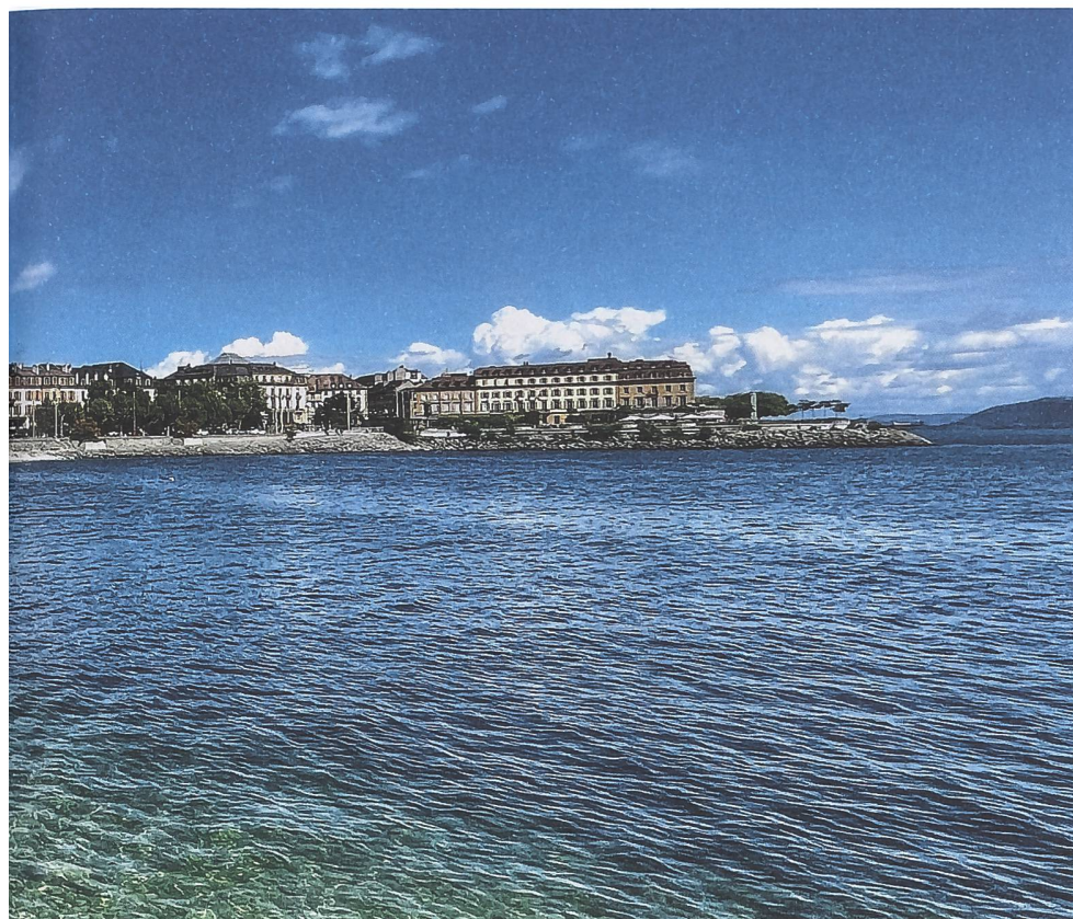
La baie de l'évêque à Neuchâtel. L'itinéraire « Sur les pas des Huguenots et des Vaudois du Piémont » longe pour une grande partie les cours d'eau sur lesquels les réfugiés se déplaçaient autrefois.