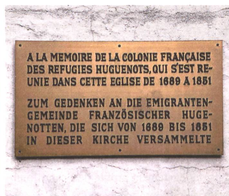
Plaque commémorative à l'Église française de Berne.

Cette publication comprend un aperçu historique approfondi et les textes des étapes fournissent de nombreuses informations intéressantes sur le patrimoine huguenot le long de l'itinéraire. À certains endroits, l'itinéraire culturel s'écarte de la route historique pour atteindre des lieux qui