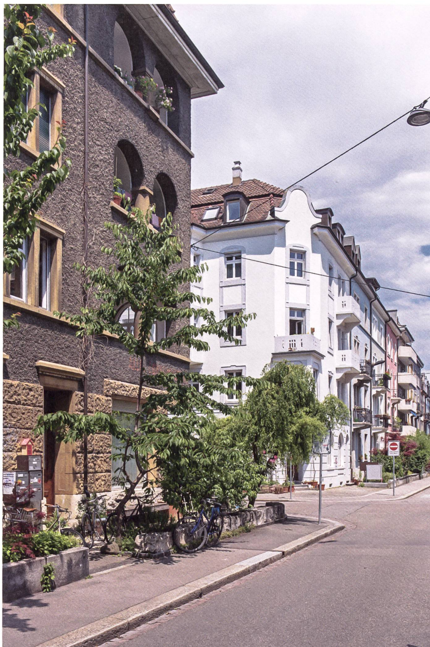
Das untere St. Johann hat noch den Charakter des Arbeiterquartiers: Hohe Wohndichte und architektonische Qualität schlossen sich um 1909–1912 nicht aus.