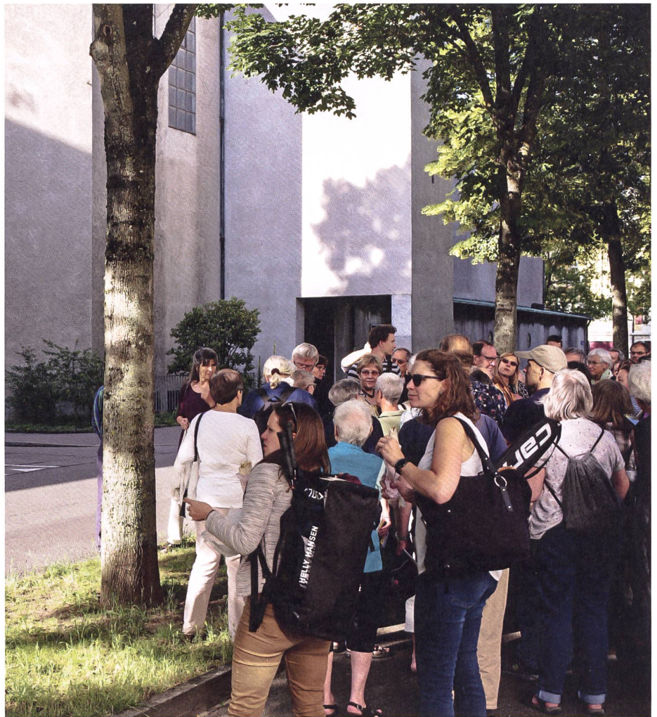
Quartierrundgänge stiessen bereits im Kulturerbejahr 2018 auf grosses Interesse der Bevölkerung: Austausch vor der Don-Bosco-Kirche im Breite-Quartier.

Von Isabelle Rihm Bertschmann und Dorin Kaiser, Rihm Kommunikation, info@rihmkommunikation.ch