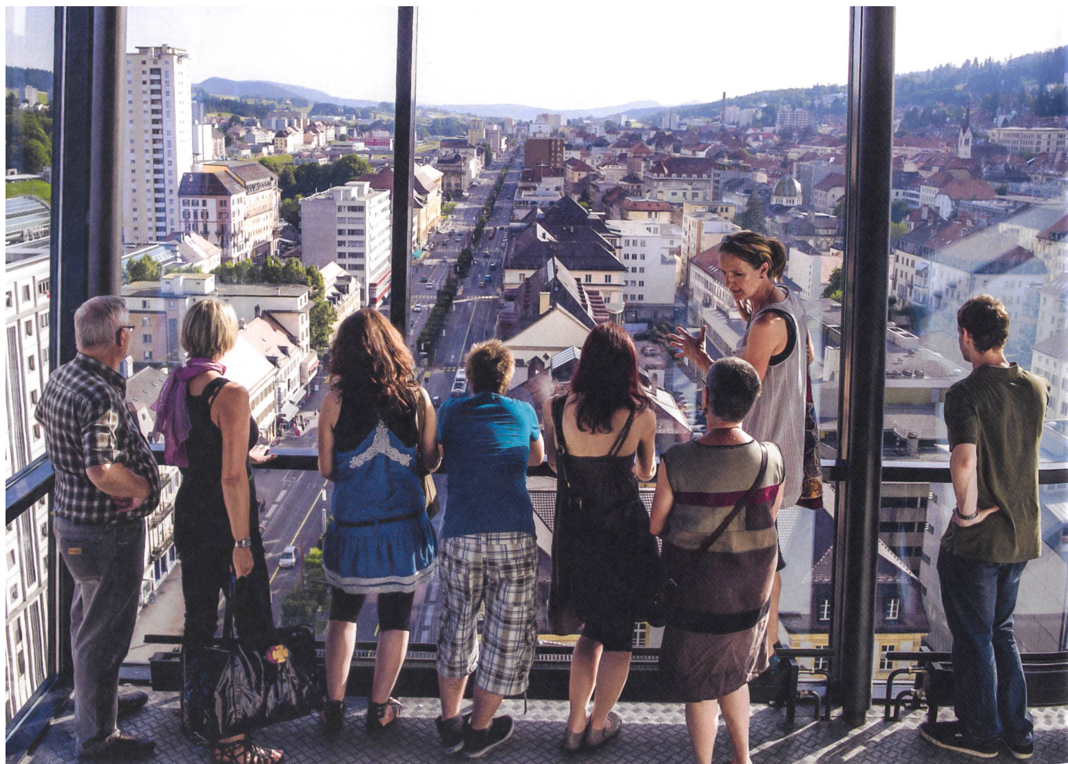
Eine Aufnahme in die UNESCO Welterbe-Liste bringt Verantwortung: Die Interessen der Einheimischen und Touristen müssen abgewogen werden.

Seit jeher ist die Auszeichnung als Unesco-Welterbe untrennbar auch mit dem Tourismus verbunden. Wird eine Stätte neu in die Welterbe-Liste der Unesco aufgenommen, gewinnt sie automatisch an Bekanntheit. Dies löst unterschiedliche Reaktionen aus. So ermöglicht sie einerseits neue Einnahmequellen. Wenn die lokalen Akteure aber nicht genügend auf die Besucherströme vorbereitet sind, kann sie andererseits im schlimmsten Fall gar den «aussergewöhnlichen universellen Wert» einer Stätte gefährden. In der Schweiz ist dieses Szenario glücklicherweise noch weit entfernt. Damit dies so bleibt, ist es wichtig, sich stetig für einen qualitativ hochwertigen und nachhaltigen Tourismus einzusetzen. Genau das tut der Verein World Heritage Experience Switzerland (WHES) seit über zehn Jahren. Im nachfolgenden Interview gibt Nadia Fontana Lupi, Präsidentin von WHES Auskunft.