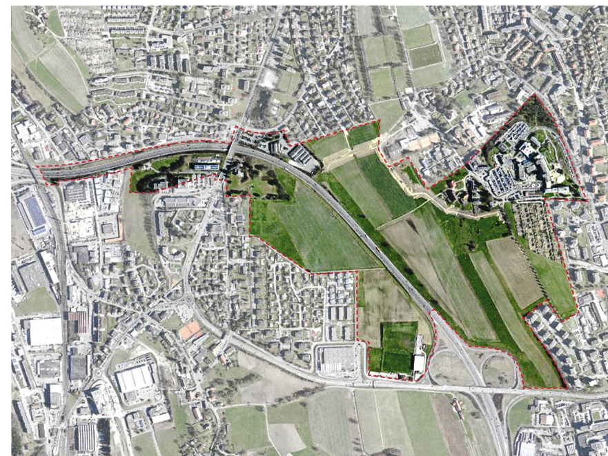
◀ Fig. 1: Vue aérienne Un territoire typique de l'agglomération contemporaine.

Voilà des années que le projet de couverture de l'autoroute N12 à l'ouest de Fribourg, entre ses jonctions nord et sud, refait régulièrement surface. Cette planification d'envergure au cœur de l'agglomération entre dans une nouvelle phase de matérialisation depuis que le canton en a pris les rênes début 2018. La responsable du dossier à la Direction de l'aménagement, de l'environnement et des constructions dresse un état des lieux des démarches en cours et présente les enjeux considérables du projet à l'heure de la transition écologique et de la nécessaire densification vers l'intérieur. Ou comment s'organise à Fribourg la réflexion sur l'extension de la ville, entre remaillage et nouveau pôle urbain.