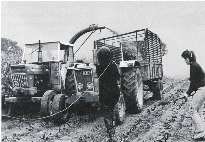
Tournage du documentaire vidéo «Profession: agricultrice» par Carole Roussopoulos, 1982.