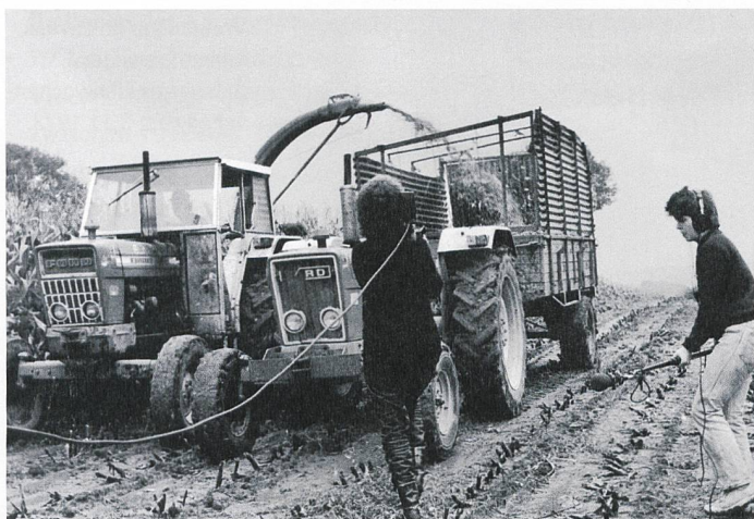
Tournage du documentaire vidéo «Profession: agricultrice» par Carole Roussopoulos, 1982.