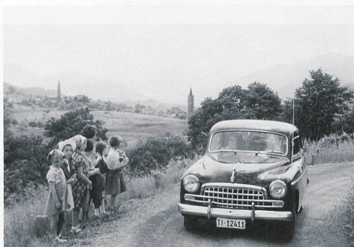
Tessiner Schatzjagd, ein radiogelenktes Automobil-Rallye im Tessin; Preis war ein kleiner, vergrabener Goldbarren. Filmstill aus der Schweizer Filmwochenschau vom 8.6.1956.