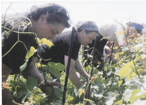
Weinanbau im Lavaux. Filmstill aus der Schweizer Filmwochen- schau vom 9.11.1973.