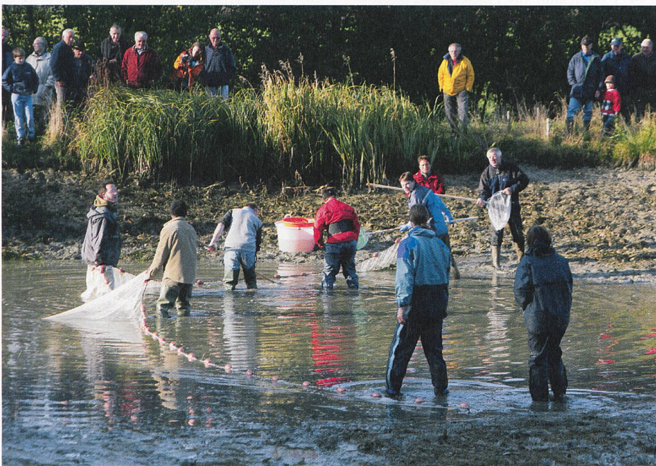
Abb. 4: Das Abfischen im Herbst bildet den Höhepunkt im Karpfenjahr. Im Rahmen des Projekts «Karpfen pur Natur» werden Kultur und Natur optimal vereint.

Weitere Informationen zum Projekt «Karpfen pur Natur»: www.karpfenpurnatur.ch