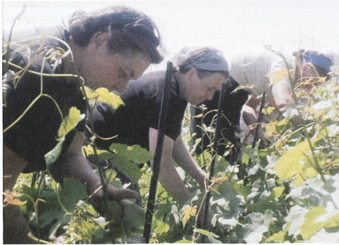
Weinbau im Lavaux. Filmstill aus der Schweizer Filmwochen- schau vom 9.11.1973.