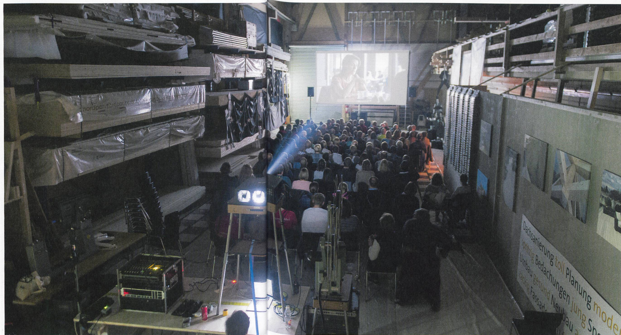
Das mobile Kino Roadmovie ist seit 15 Jahren unterwegs. Dieses Jahr mit der Schweizer Filmwochen- schau im Gepäck.