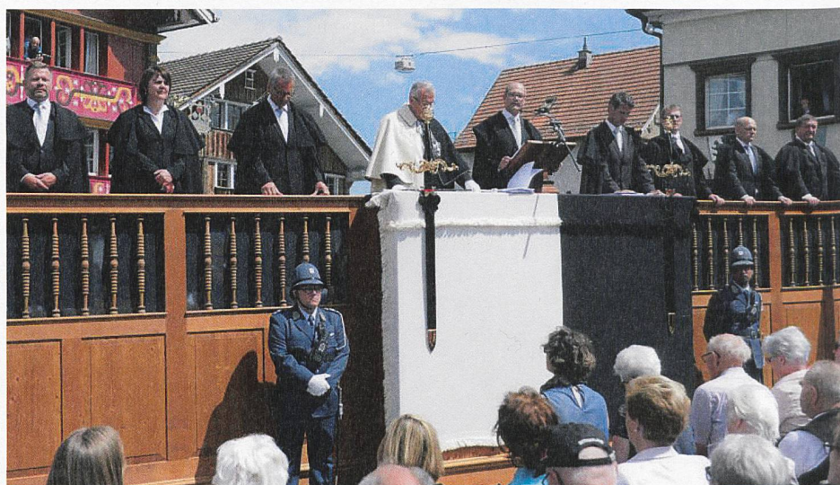
Der regierende Landammann übernimmt nach seiner Wahl das Landessigill und verspricht dem Landsgemeindevolk, dieses nach Verfassung und Gesetz zu gebrauchen.

So richtig los aber geht das gesellschaftliche Ereignis Landsgemeinde für viele erst nach der Versammlung – und das grosse Feiern und Festen auf den Gassen und in den Gasthäusern von Appenzell endet oft erst in den frühen Morgenstunden. Es sind buchstäblich «alle» da und zu diesen gesellen sich sehr viele Heimweh-Innerrhoderinnen und -Innerrhoder.