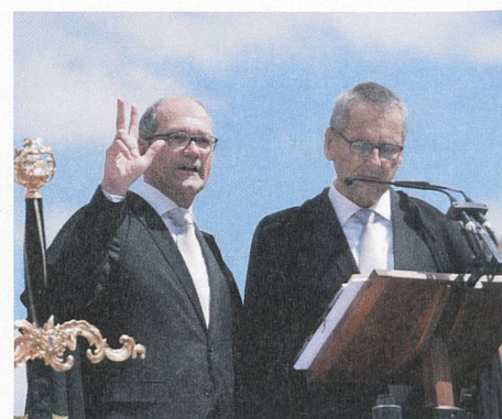
Die Eidesleistung des regierenden Landammanns.

Auf dem Landsgemeindeplatz folgt das Zusammenstehen – auch im übertragenen Sinn: Man wird als Einzelner ein Teil des Ganzen, fühlt sich der politischen Schicksalsgemeinschaft zugehörig; soziale Gegensätze sind, zumindest für die Dauer der Landsgemeinde, nicht relevant. Man steht aber nicht nur zusammen – Volk und Regierung stehen sich Auge in Auge gegenüber; man legt Rechenschaft ab und verspricht, sich gegenseitig zu unterstützen und für das Land einzustehen. Der abstrakte Staat, die anonyme Bürokratie werden konkret erlebbar. Das «Wir sind das Volk», das wir alle noch in den Ohren haben, wird an der Landsgemeinde zur alljährlichen Selbstver-