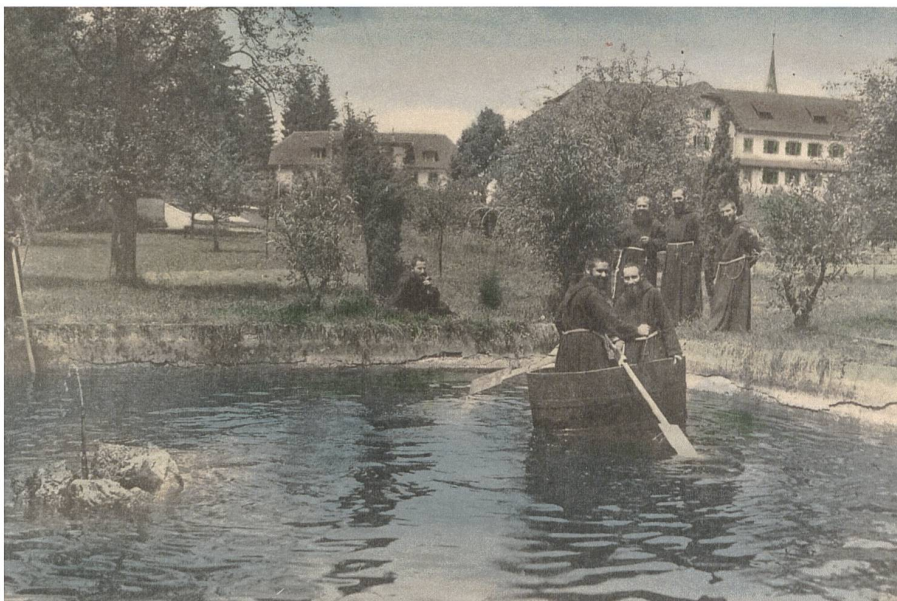
Abb. 2: Die Kapuziner am Feuerwehrturm der Klosters, 1920er-Jahre: Noch bis ins 20. Jahrhundert war das Kapuzinerkloster die Heimat einer grösseren Bruderschaft. Die Zusammensetzung der Nutzer hat sich inzwischen geändert.

Ergänzend zur Verdichtung im Altbau soll auch der Freiraum besser aktiviert werden. Dazu gehören die Neugestaltung des Klostergartens sowie ein Neubau für Wohnungen, dessen Mieteinnahmen den Unterhalt des Klosters mitfinanzieren sollen (Abb. 3). Während der Garten geöffnet wird und damit dem Quartier zukünftig als wertvoller Freiraum zur Verfügung steht, bringt das neue Gebäude zusätzliche Bewohner auf das Areal. Ausgehend von einer Machbarkeitsstudie