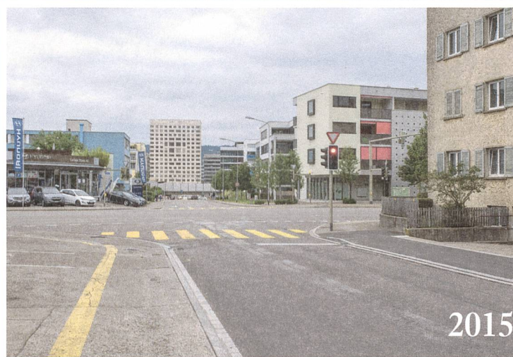
Abb. 1: Entwicklungsgebiet Schlieren West, Kreuzung Nassacker- strasse – Badenerstrasse, Blick nach Norden: Bau neuer Wohnsiedlungen der Migros Pensionskasse und der Sied- lung Gartenstadt der Alfred Müller AG, im Hintergrund das Minergie-Hochhaus der Über- bauung «amRietpark».