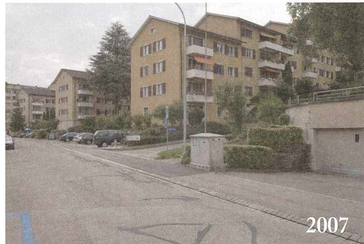
Abb. 3: Wohngebiet Kampstrasse, Blick nach Südosten: Siedlung der Gemeinnützigen Baugenos- senschaft Limmattal GLB.

Prozesse von Alterung und Instandstellung in Wohnquartieren aus der Nachkriegszeit (Abb. 3), Standorte, an denen die Zeit stehen zu bleiben scheint.