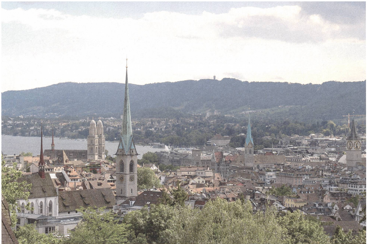
Städtebaulicher Freiraum: die Zürcher Innenstadtkirchen.