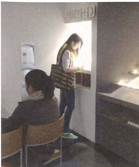
Religiöser Freiraum: Bahnhofkirche Zürich.