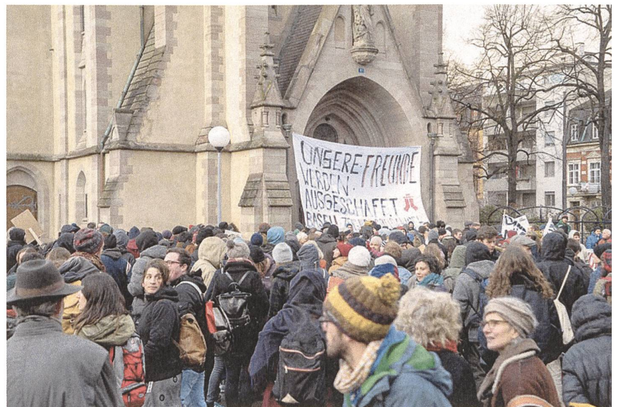
Symbolischer Freiraum: Matthäuskirche Basel.