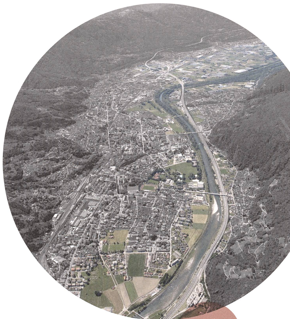
Foto aerea con evidenziato l'asse del fiume Ticino.

grandi dimensioni e importanza. Il progetto dimostra infatti come il nuovo ospedale possa essere inserito nel comparto preservando ampie aree verdi, allo scopo di mantenere il valore pubblico del luogo e garantendo delle aree di «riserva» per gli sviluppi futuri dell'ospedale. Sono stati elaborati degli schemi che mostrano come il «Comparto Saleggi» sia in grado di ricevere come prima fase un nuovo ospedale (dimensioni suggerite dall'Ente Ospedaliero Cantonale: 60 000 mq) e che possa adeguarsi con estrema flessibilità agli sviluppi della tecnologia ospedaliera. In tutte le fasi è mantenuta