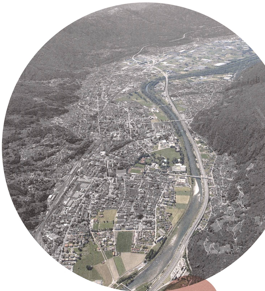
Foto aerea con evidenziato l'asse del fiume Ticino.

causa degli sviluppi della disciplina. Il comparto è particolarmente adeguato ad ospitare un ospedale in quanto permette la creazione di un primo insediamento in grado di svilupparsi nel tempo.