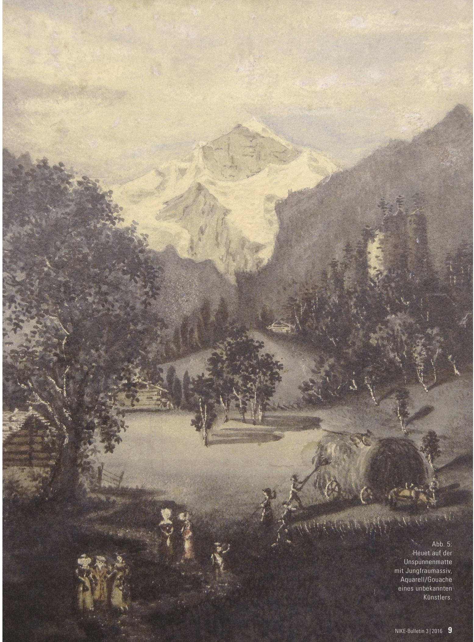
Abb. 5: Heuet auf der Unspunnenmatte mit Jungfraumassiv, Aquarell/Gouache eines unbekanntes Künstlers.