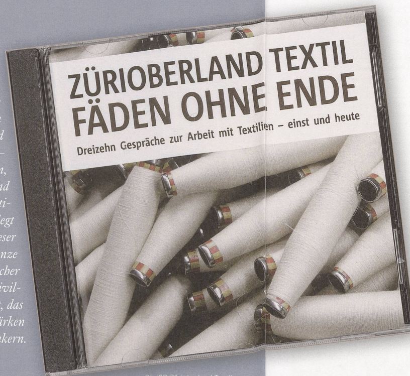
Die CD Zürcher Oberland Textil – Fäden ohne Ende war eines der ersten Projekte von «Zürcher Kulturerbe».

Regionales Kulturerbe zu pflegen ist eine Aufgabe, welche schweizweit auf den Agenden zahlreicher Organisationen, Institutionen und kantonalen Ämter steht. Wie aber können – neben Sammlungen kulturhistorischer Museen, denkmalpflegerisch geschützten Gebäuden und archäologischen Stätten – die regionalen Traditionen und das lokale Brauchtum erhalten, gepflegt und vermittelt werden? Zur Beantwortung dieser Frage wurden in den letzten Jahren eine ganze Reihe von Tagungen organisiert und etliche Bücher publiziert. Im Zürcher Oberland hat es eine zivilgesellschaftliche Initiative beispielhaft geschafft, das Bewusstsein für das regionale Kulturerbe zu stärken und in der Politik breit zu verankern.