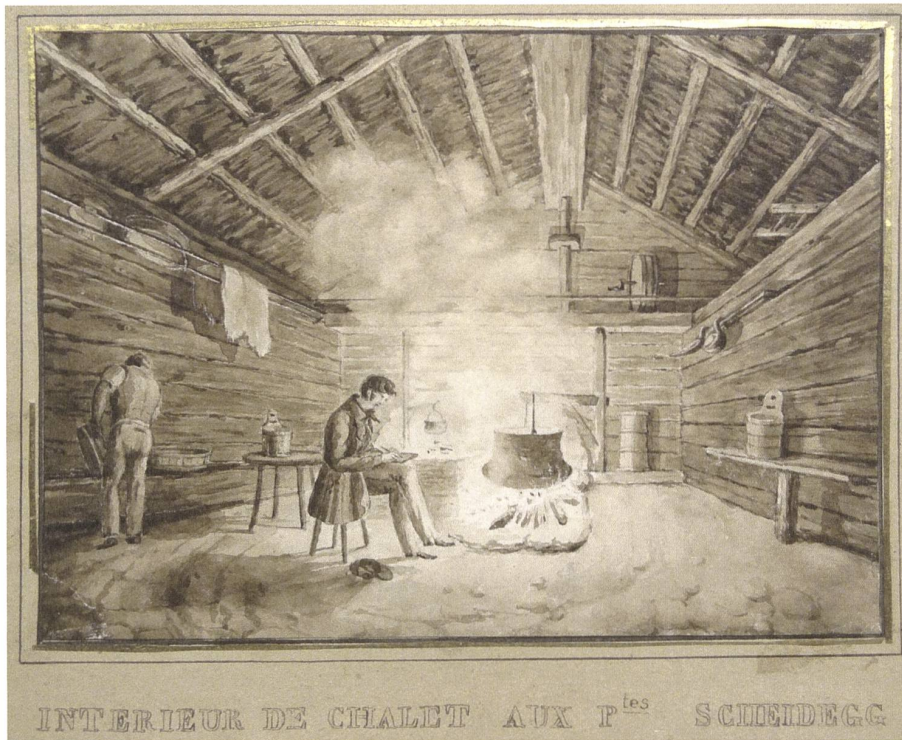
Abb. 4: Anonym: Schreibender Tourist im «Intérieur de chalet aux p tes Scheidegg», Sepia- Aquarell um 1820.

spunnen (Wilderswil BE) auf dem Bördeli zwischen Thuner- und Brienzersee.