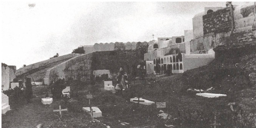
Der Friedhof im südspanischen Dorf Almuñécar um 1958.