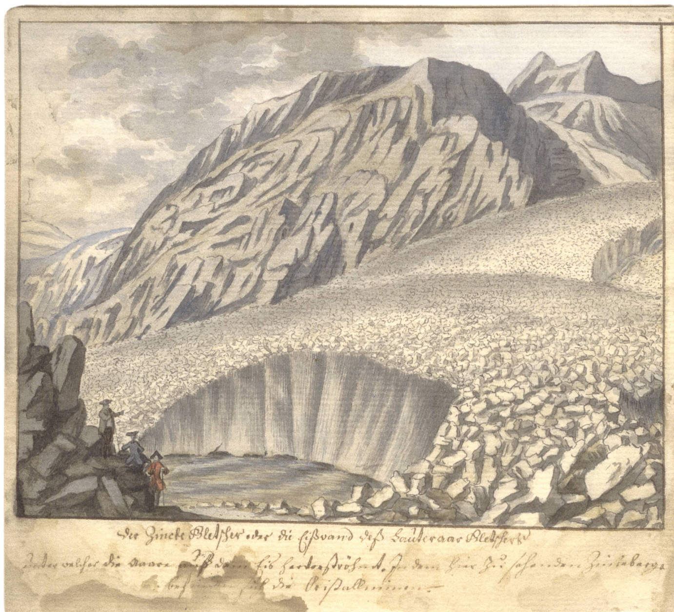
Abb. 1: S. H. Grimm: «Der Zincke Gletscher oder die Eißwand des Lauteraar Gletschers», Aquarell vor 1760.