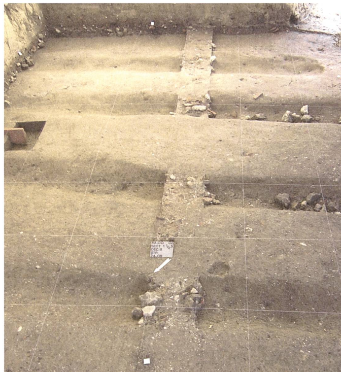
Fossés mis au jour dans la cour face au bâtiment central.

tation et des espaces utilitaires. A l'arrière du bâtiment s'élève un grenier ( horreum ) identifiable par les piliers qui soutenaient un plancher surélevé.