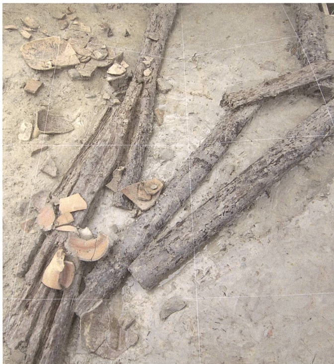
Conduits en sapin conservés dans l'un des chenaux.