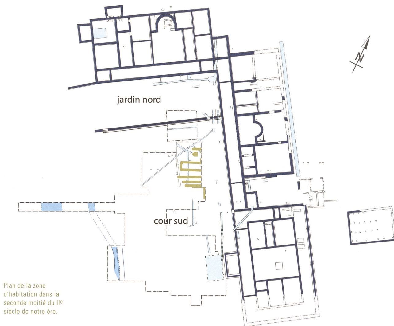
Plan de la zone d'habitation dans la seconde moitié du II e siècle de notre ère.

mosaïques, l'une dite de Bacchus et Ariane dans le bâtiment central, l'autre de la Venatio dans une salle d'apparat du bâtiment nord à l'époque sévérienne.