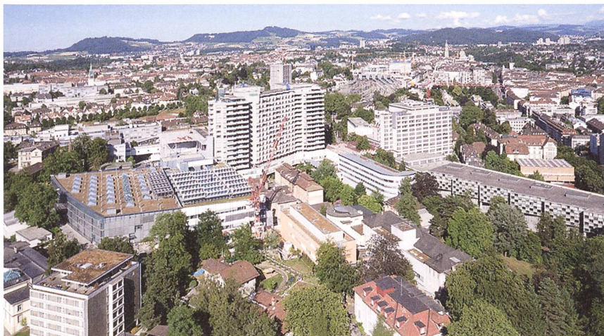
Resultat eines un- gemein raschen und teilweise chaotischen Wachstums: das Inselspital heute.

in der Anlage des Klinikareals keine Logik mehr erkennbar ist. Darüber hinaus stösst der Betrieb heute logistisch an seine Grenzen. 2010 wurde darum ein Wettbewerb durchgeführt für einen Masterplan, der die Weiterentwicklungen, namentlich eine Verdoppelung der Nutzfläche, in den nächsten 60 Jahren regulieren soll. Sieger des Wettbewerbs wurde das Münchner Büro Henn Architekten.